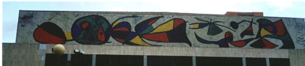
Fig. 21: Mural del Palacio de Congresos de Madrid. Joan Miró.

Además de los museos nacionales del Prado y Reina Sofía, hay otros muy conocidos internacionalmente: el Museo Picasso, en Barcelona; el Museo Thyssen-Bornemisza, en Madrid, y el Museo Guggenheim de Bilbao.