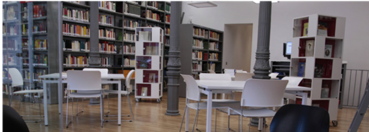
Fig. 34: Biblioteca de la sede central del Instituto Cervantes en Madrid.

los centros culturales públicos: ofrecen visitas virtuales o guiadas, talleres, etc.