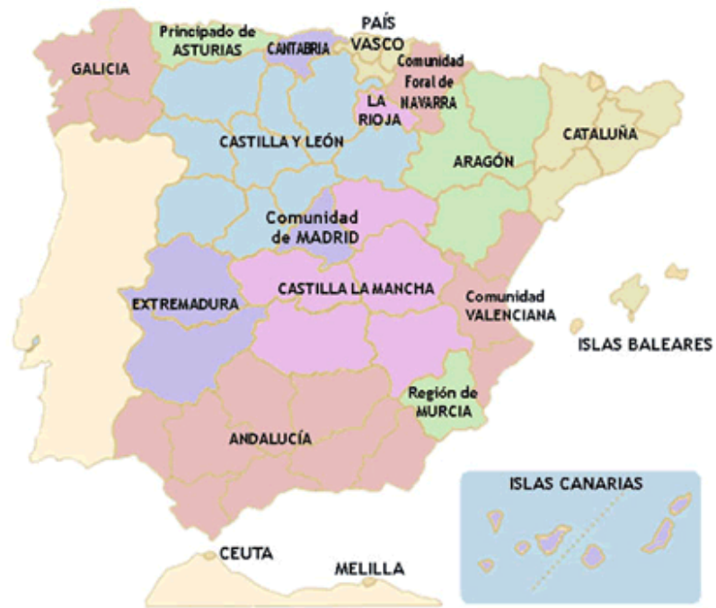
Fig. 16: Mapa político de las comunidades autónomas de España.