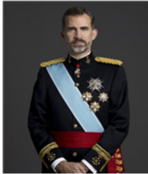
Fig. 4: Felipe VI, Rey de España

En España se permite reinar tanto a hombres como a mujeres. El heredero de la corona tiene el título de Príncipe o Princesa de Asturias. El Rey tiene su residencia oficial en el Palacio Real, pero vive en el Palacio de la Zarzuela.