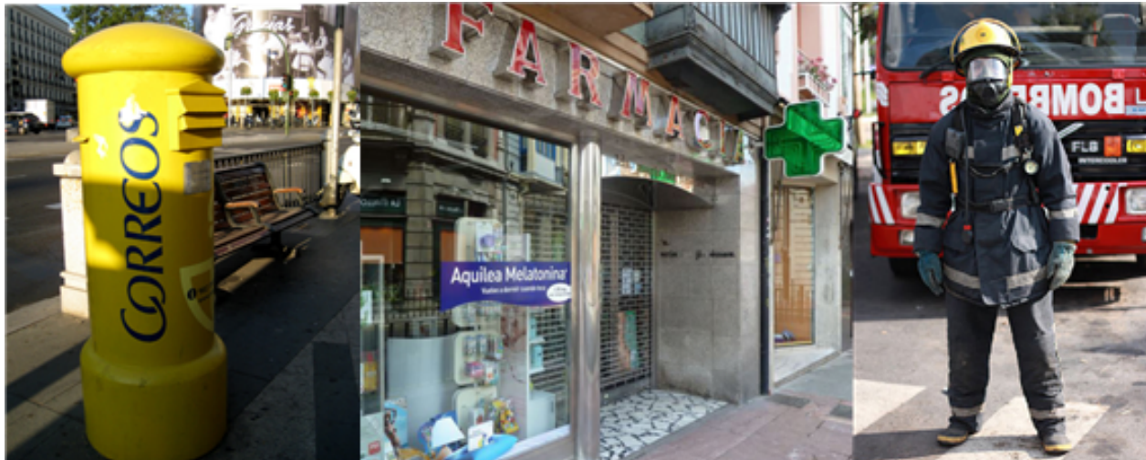
Fig. 41: Imágenes de un buzón de Correos, de una farmacia y de un bombero.

quioscos: se venden periódicos, revistas, coleccionables, etc.