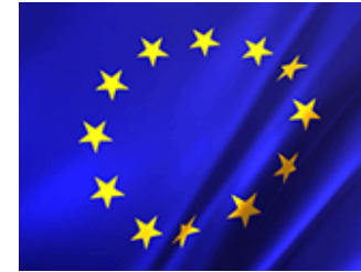
Fig. 5: Bandera de la Unión Europea.

Naciones Unidas (ONU); el Consejo de Europa (CE); la Organización del Tratado del Atlántico Norte (OTAN); la Organización para la Cooperación y el Desarrollo Económico (OCDE); la Organización para la Seguridad y la Cooperación en Europa (OSCE). Un lugar especial en las relaciones internacionales de España lo ocupa la Comunidad Iberoamericana de Naciones.