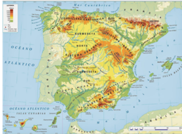
Fig. 14: Mapa físico de España.