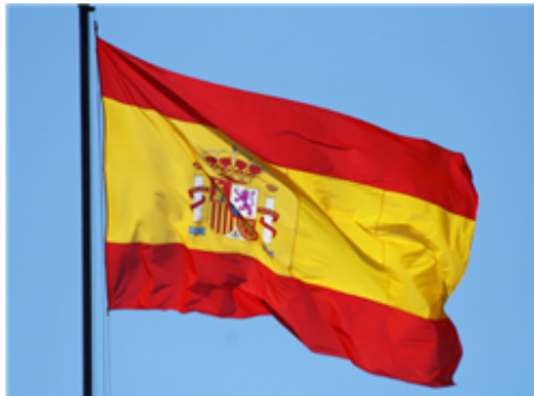
Fig. 2: Bandera de España

La bandera de España tiene tres franjas (roja, amarilla y roja): cada comunidad autónoma tiene su propia bandera y debe utilizarla junto a la española en sus edificios públicos y en sus actos oficiales.