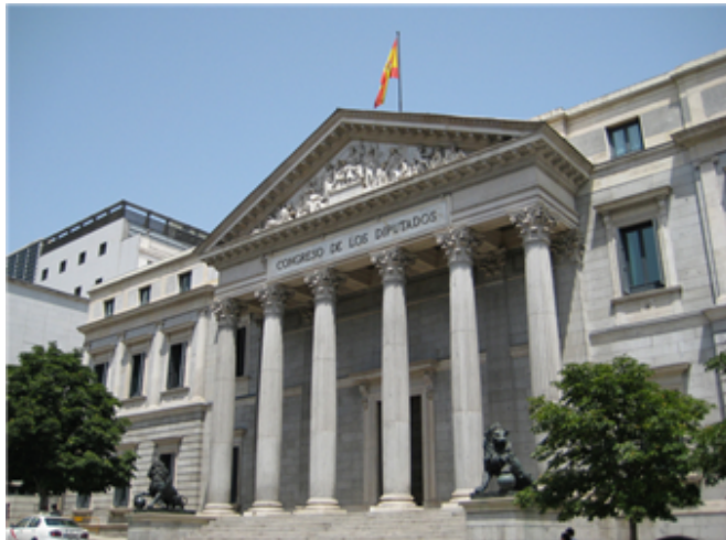
Fig. 6: Congreso de los Diputados.

Las Cortes Generales (nombre oficial del Parlamento español) representan al pueblo español y están formadas por dos cámaras, el Congreso de los Diputados y el Senado. Las funciones principales de las Cortes Generales son crear y aprobar los proyectos de ley del Estado, aprobar sus presupuestos y controlar la acción del Gobierno.