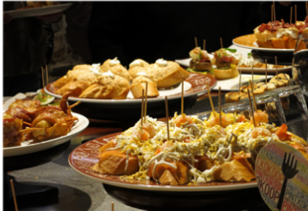
Fig. 31: Barra con pinchos en el País Vasco

Los horarios de las comidas en España son distintos según el día de la semana y las costumbres de cada familia, pero se podría decir que el desayuno es de 7:30 a 8:30, la comida de 14:00 a 15:30 y la cena de 21:00 a 22:00 horas.