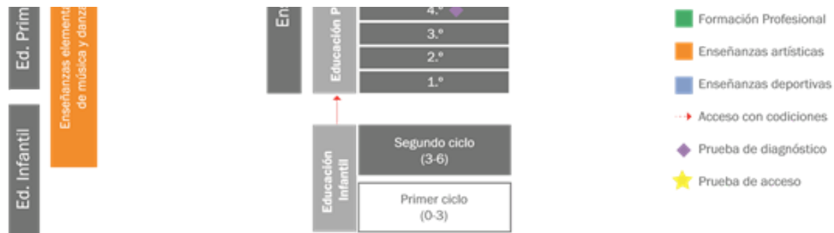
Fig. 50: Sistema educativo español