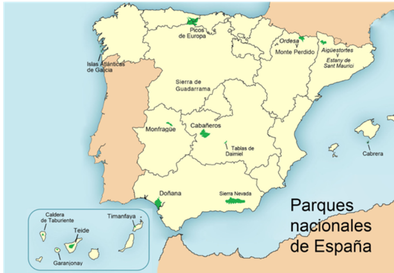
Fig. 15: Parques nacionales de España.

Los parques nacionales de España son, en la actualidad, Islas Atlánticas de Galicia; Picos de Europa (Asturias); Ordesa y Monte Perdido (Pirineos); Aigüestortes y Estany de Sant Maurici (Cataluña); Monfragüe (Extremadura); Sierra de Guadarrama (Madrid); Cabañeros y Tablas de Daimiel (Castilla-La Mancha); Doñana y Sierra Nevada (Andalucía), Archipiélago de Cabrera (Islas Baleares) y Caldera de Taburiente, Teide, Timanfaya y Garajonay (Canarias).