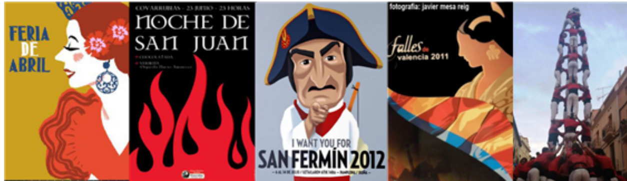
Fig. 25: carteles de fiestas tradicionales de España de repercusión internacional