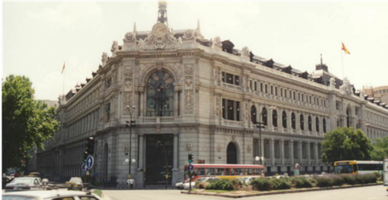
Fig. 48: Banco de España

Algunas de las instituciones económicas más importantes de España son el Banco de España, la Bolsa (el IBEX 35), el Instituto Español de Comercio Exterior (ICEX), el Consejo Económico y Social de España (CES) o la Seguridad Social de España.