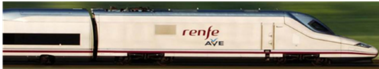
Fig. 46: AVE, tren de alta velocidad española

Puertos más importantes: Algeciras, Barcelona, Las Palmas, Bilbao, Valencia y Vigo.